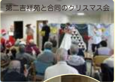
第二吉祥苑と合同のクリスマス会