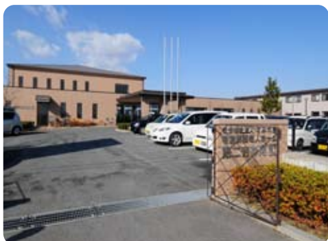
特別養護老人ホーム【第二吉祥苑】に隣接の施設です。(右側が「昴」です)