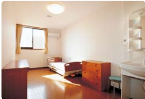
外来者が宿泊できるお部屋もご用意しています。